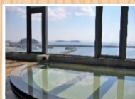
準天然光り明石温泉

11:30-16:00は、日帰り入浴ができます。タオルはついておりませんので、ご持参ください。浴室清掃日は14:00-16:00の利用となります。ご了承ください。